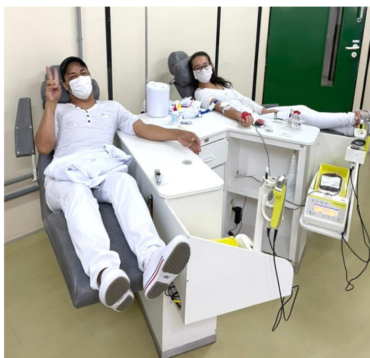
Alunos do Senac doam sangue