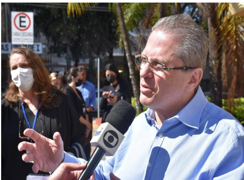
O mutirão, que ocorre desde junho, tem o objetivo de zerar a demanda reprimida de cirurgias no Estado