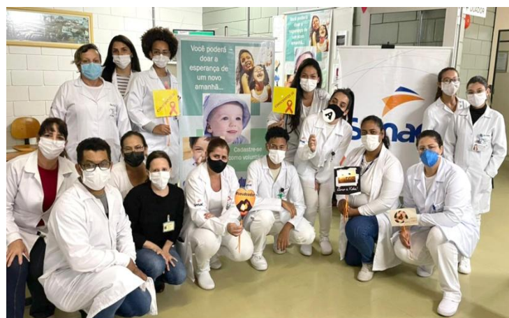
Alunos do Senac e equipe do Hemocentro

Outra grande contribuição veio da Fundação Casa com doações de colaboradores da unidade de Marília, que se mobilizaram para auxiliar na regularização dos estoques.