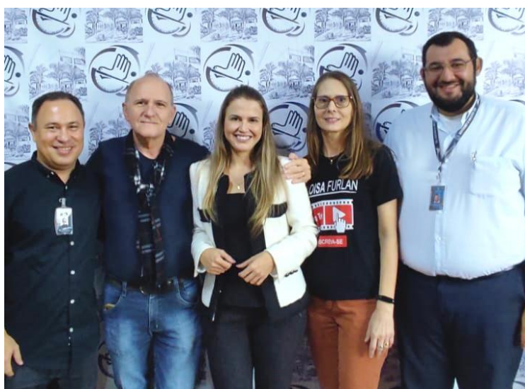
Equipe gestora da Escola Estadual Cultura e Liberdade recebe a equipe do HCFAMEMA