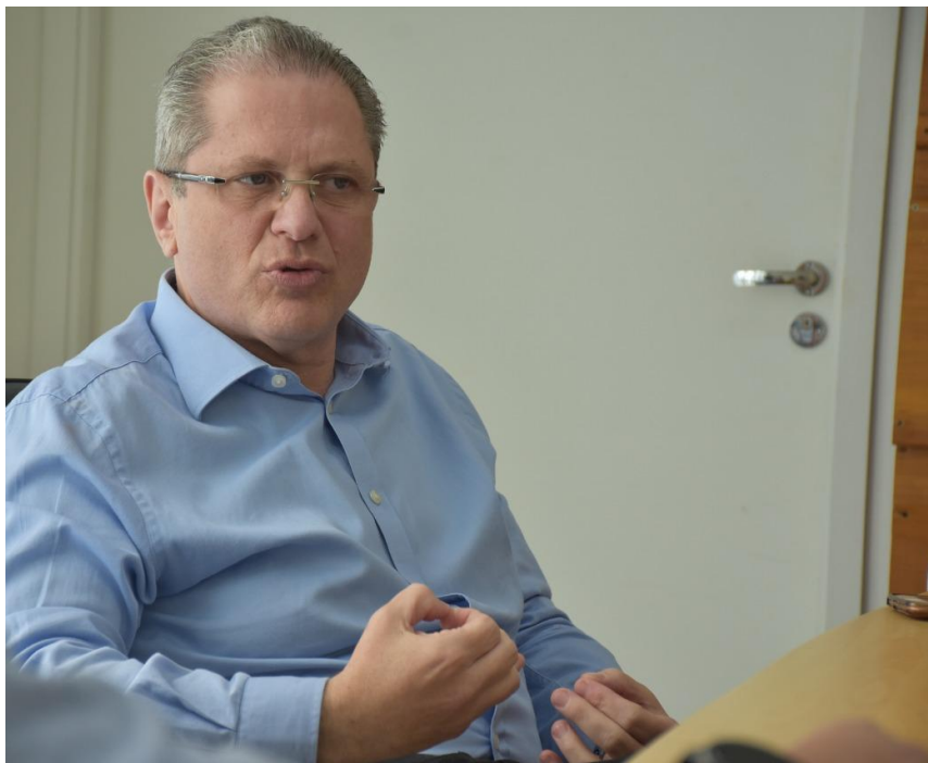
O Secretário Estadual da Saúde, Jean Gorinchteyn, em visita ao HCFAMEMA

Destacou o Secretário de Estado da Saúde, Jean Gorinchteyn