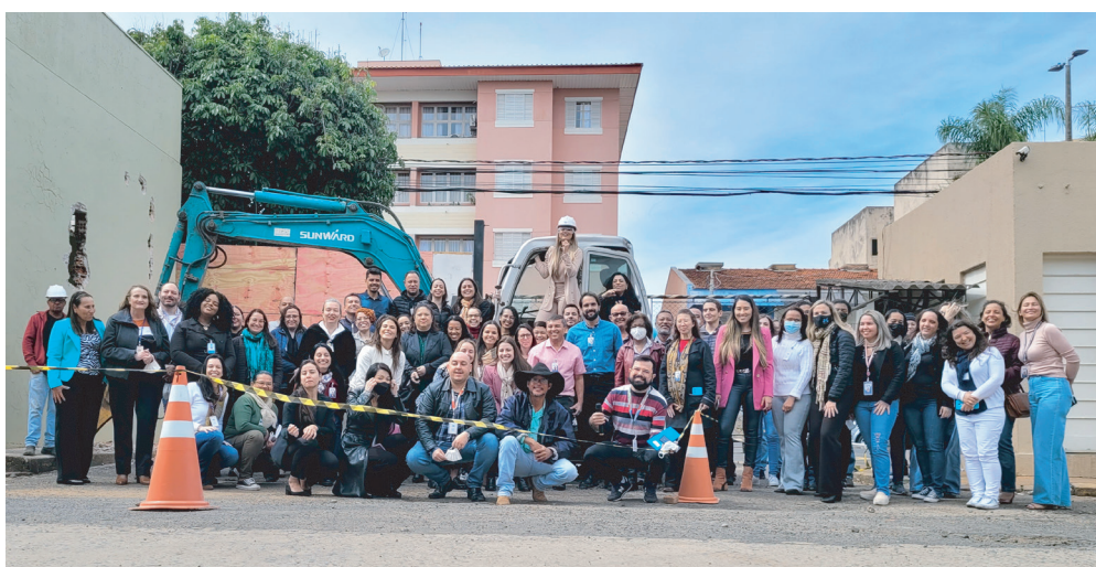
O ato memorial ocorreu na presença de colaboradores e parceiros

consórcio formado pelas construtoras Incorplan e SIAN Engenharia, que respondem pela obra.