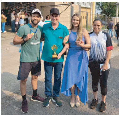
No HCFAMEMA foi recebido com medalha de honra ao mérito

A partida do atleta ocorreu às 00h e a chegada aconteceu por volta das 15h, frente ao Ambulatório Mário Covas. O momento foi bastante comemorado entre os amigos e pelo seu pai, que acompanhou toda a viagem em um carro de apoio.