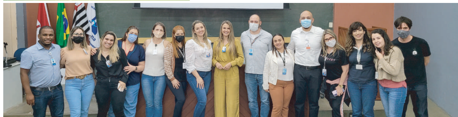
Equipe Lean nas Emergências HCFAMEMA já comemora resultados positivos

O “Projeto Lean nas Emergências” é iniciativa do Ministério da Saúde que trouxe para o HCFAMEMA o acompanhamento do Hospital Beneficência Portuguesa, de São Paulo.