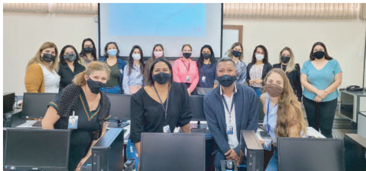
O treinamento foi realizado pelo Núcleo de Ingresso HCFAMEMA