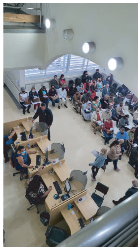
As avaliações cirúrgicas ocorrem no Ambulatório Mário Covas