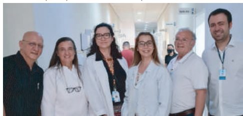
Equipe assistencial envolvida nas avaliações cirúrgicas