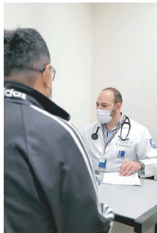
Paciente durante atendimento de avaliação cirúrgica

Conforme dados da Secretaria do Estado da Saúde, mais de 40 mil pacientes encontram-se na fila de espera na região de Marília, que é composta por 62 municípios.