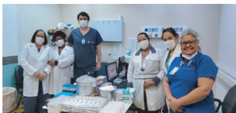
Exames pré-operatórios também passaram a ser realizados