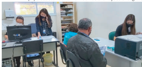
Pacientes foram avaliados e receberam orientações

“ Levamos desse período muitas lições aprendidas, mas principalmente a certeza de que fizemos a diferença na busca de cumprir nossa missão à população SUS ”