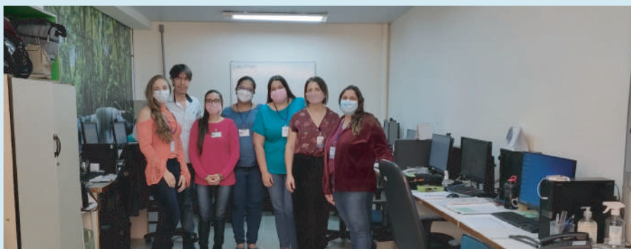
Gerência de Gestão, Planejamento e Controle em sala ao lado da Gerência de Comunicação