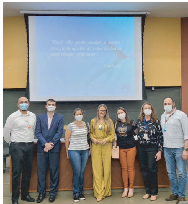
O projeto conta com o apoio de profissionais da Beneficência Portuguesa