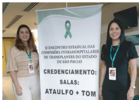
Representantes do HCFAMEMA durante premiação