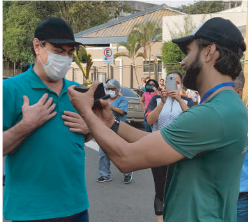
Pai do atleta permaneceu internado 72 dias na UTI do HCFAMEMA

Como parte do cumprimento de uma promessa, ele percorreu os 90 quilômetros de distância entre Marília e Cândido Mota, cidade em que eles residem, em um percurso feito em grande parte por corrida.