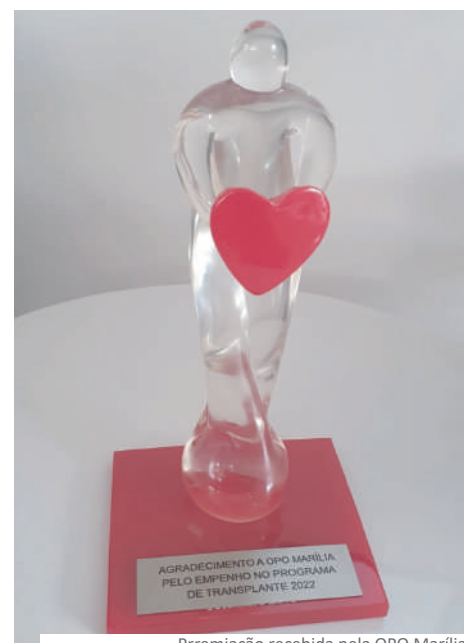
Prremiação recebida pela OPO Marília

Na ocasião a OPO Marília recebeu o troféu “Amigo do Transplante”, concedido pelo trabalho multidisciplinar desenvolvido na região, com o objetivo de acolher, preparar e instruir os familiares de doadores de órgãos, atuando com precisão e eficiência no processo que culmina com captações de órgãos com sucesso.