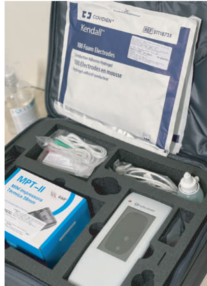
Equipamento utilizado para triagem auditiva

São procedimentos não invasivos, rápidos, com tempo de duração de 10 a 15 minutos e indolor. São feitos através da colocação de um pequeno fone de ouvido na orelha do bebê.