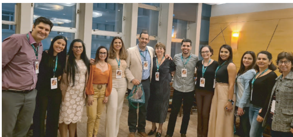
Evento reuniu representantes das unidades de Organização e Procura de Órgãos (OPO)