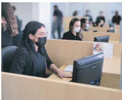
Colaboradores administrativos e assistenciais foram escalados

Para que os atendimentos fossem viabilizados, uma grande força tarefa composta por colaboradores administrativos e assistenciais foi colocada em ação.