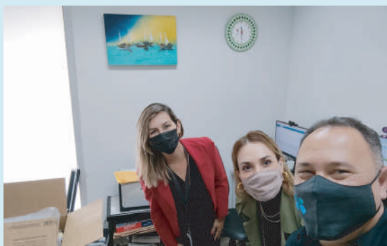
Chefia de Gabinete passou a ocupar sala localizada no prédio da Superintendência