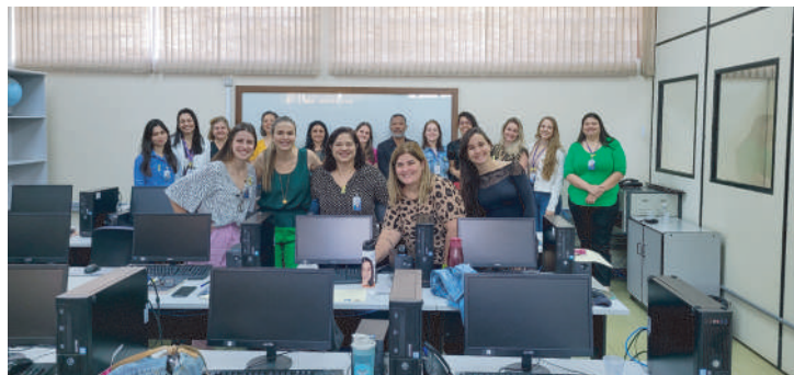
As instruções totalizam 26 horas e são sucedidas de avaliação

O Departamento de Gestão de Pessoas (DGP) realizou o primeiro treinamento de colaboradores HCFAMEMA através do Programa de Imersão de Líderes – Pertencer.