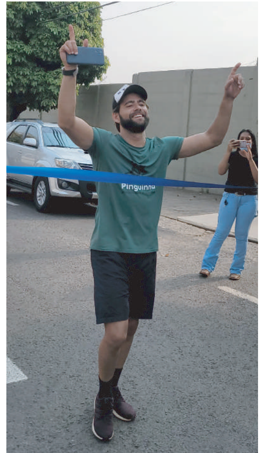
Emoção marcou a chegada do atleta à linha de chegada

Para vencer o desafio, também chamado por ele de “Corrida pela Vida”, intensificou os treinos nos últimos dois meses.