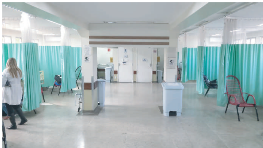
Registros realizados entre os dias 19 e 21 de agosto mostram ambientes e corredores livres

O Projeto Lean nas Emergências já vem apresentando resultados satisfatórios. Registros realizados entre os dias 19 e 21 de agosto mostram corredores e sala de transição de pacientes totalmente livres.