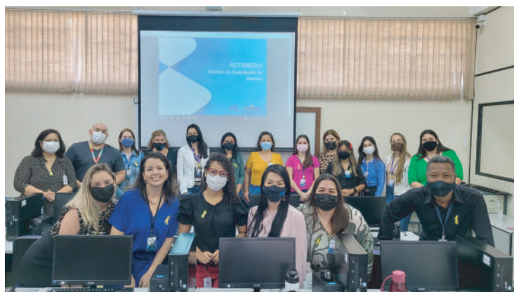
O propósito é apresentar ao colaborador os seus direitos, deveres e obrigações

Ao término do treinamento o participante deverá tramitar ao Núcleo de Ingresso, no prazo de até 15 dias, a cópia do certificado do curso ofertado pela plataforma SP Sem Papel. Também será solicitada a realização das avaliações de reação e apreendido.