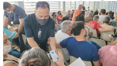
Acolhimento foi um dos diferenciais