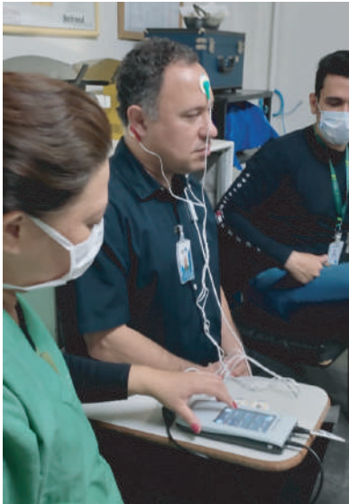
Equipe durante treinamento no HMI

Um dos equipamentos é o Aparelho de Emissões Otoacústicas, o qual é usado para triagem auditiva neonatal, exame conhecido como “teste da orelhinha” - um dos métodos mais modernos para constatar disfunções auditivas em recém-nascidos. O outro equipamento será utilizado para realização do BERA Triagem (Brainstem Evoked Response Audiometry).