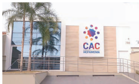
CAC atende de segunda a sexta-feira, das 7h às 16h

Vale destacar que o atendimento para Síndrome Gripal ocorre de segunda a sexta-feira das 07 as 11 da manhã.